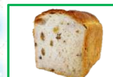
35. 食ぱん③(くるみ) 360円