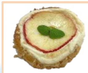
4. リンゴスター 240円