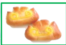
8. ミニクリームパン 80円 (1個入り)