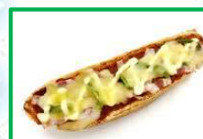
25. ピザフランス 210円