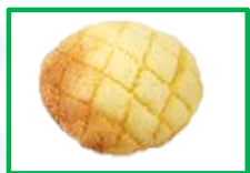
9. メロンパン 150円