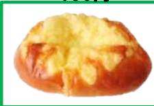
18. チーズたっぷりぱん 200円