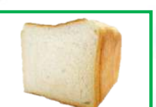
33. 食ぱん①(プレーン) 270円