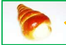
13. コルネ 150円