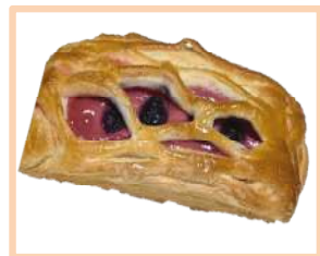
3. ルビーのパン 160円