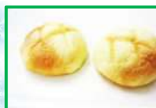
10. ミニメロンパン 80円 (1個入り)