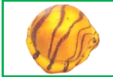
12. マーブルパン 150円