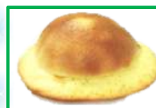
11. ぼうしぱん 150円