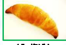
15. 塩ぱん 120円