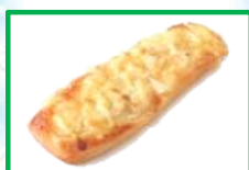
24. オニオンデニッシュ 180円