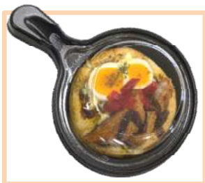
1. ぜいたくカツカレーパン 380円