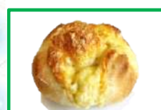
32. チーズフランス 200円