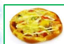
21. ピザぱん 240円