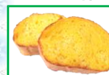
27. シーガルフレンチトースト 160円