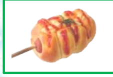
17. フランクロール 180円