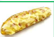
26. たまごフランス 250円