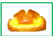
7. クリームパン 150円