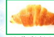
16. 塩ぱん(あんこ) 160円