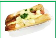
36. カレーポークサンド 380円