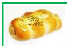
19. ちくわぱん 180円