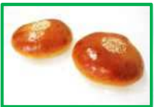
6. ミニあんぱん 80円 (1個入り)