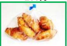
22. ミニクロワッサン 130円(6個入り)