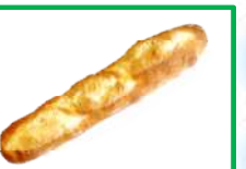
30. バケット 260円