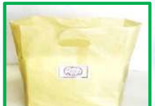
37. シーガルセット 500円