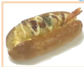
2. ノッてるえび天パン 300円