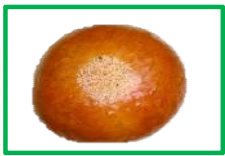
5. あんぱん 150円