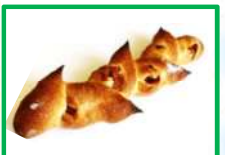
29. ベーコンエビ 230円