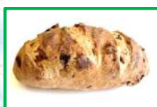
31. くるみレーズン 250円