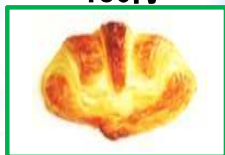
23. クロワッサン 140円