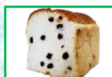
34. 食ぱん②(レーズン) 360円