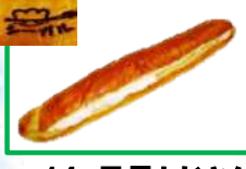
14. 足長おじさん 170円