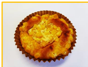
7. ベーコンパン 130円