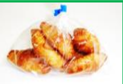
28. ミニクロワッサン 120円