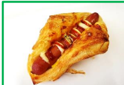
29. ウィナーデニッシュ 240円