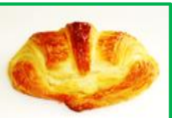
27. クロワッサン 130円