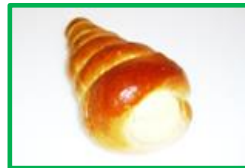
17. コルネ 140円