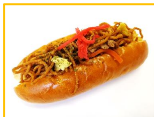
2. 焼きそばドック 160円