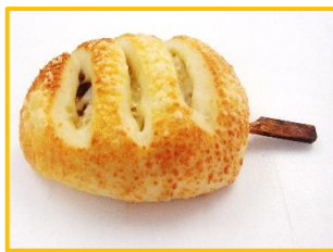
1. 焼き鳥ロール 170円