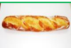
34. バゲット 250円