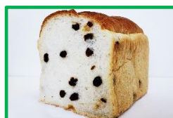
42. 食パン③ (ぶどう) 250円