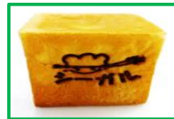
19. サイコロチョコパン 150円