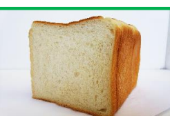
40. 食パン① 210円