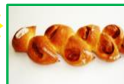
37. ベーコンエビ 200円