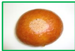
11. あんぱん 120円