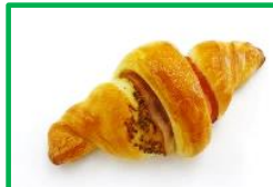
30. ベーコンクロワッサン 170円