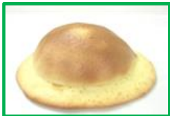
18. ぼうしぱん 130円