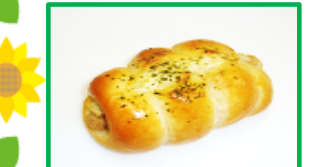
26. ちくわぱん 160円