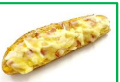
33. たまごフランス 170円