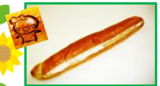
16. 足長おじさん 140円