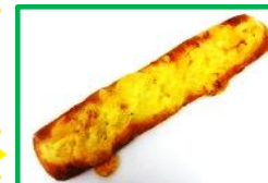
31. オニオンデニッシュ 170円