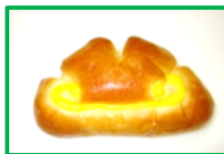
13. クリームパン 120円