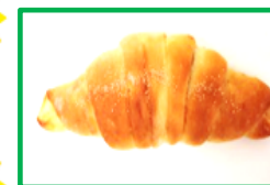
21. 塩ぱん (あんこ) 140円