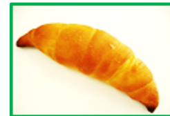
20. 塩ぱん 110円