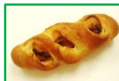
36. ベーコンフランス 150円