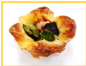
6. 夏野菜カレーパン 210円