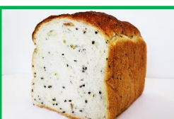
41. 食パン② (ごまいも) 250円