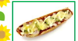
32. ピザフランス 170円