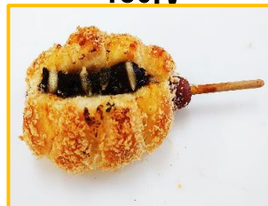
5. カレーフランク 160円