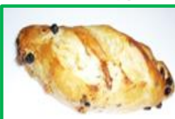
35. くるみレーズン 200円