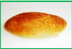
24. カレーパン 140円