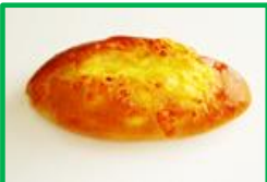
23. チーズたっぷりぱん 150円