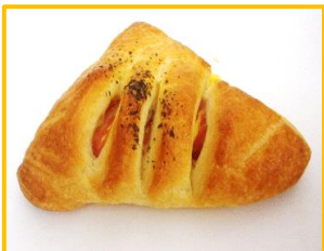
4. エッグデニッシュ 200円