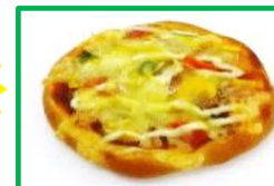
25. ピザパン 170円