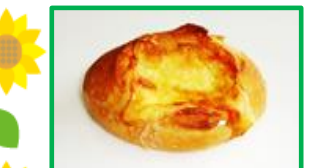
38. チーズフランス 170円