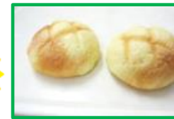
15. ミニメロンパン 60円 (1個入り)