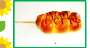
22. フランクロール 150円