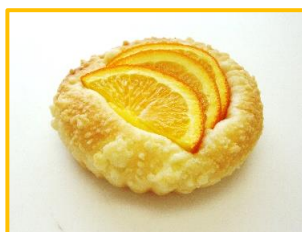
3. さわやかオレンジパン 180円