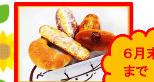
おまかせセット 500円 (注文のみ)