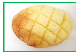
14. メロンパン 120円