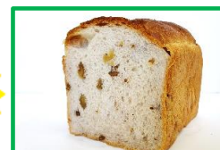
43. 食パン④ (くるみ) 250円