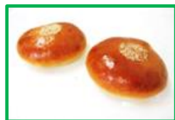
12. ミニあんぱん 60円 (1個入り)