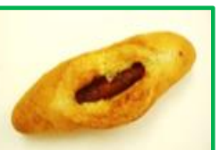
39. ガーリックフランス 170円