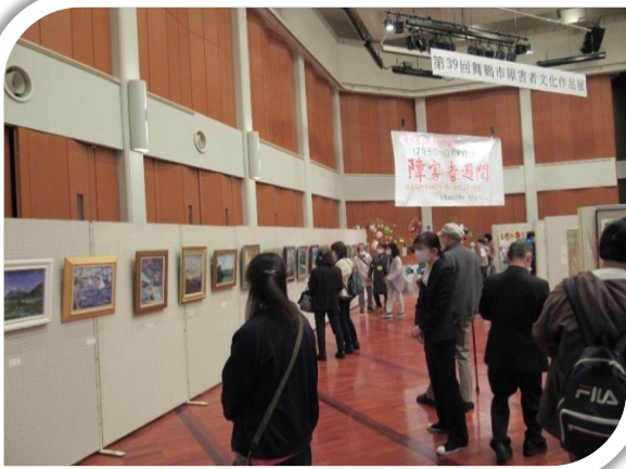
会場にいらした方々より、「感動した」というご感想をたくさんいただきました。