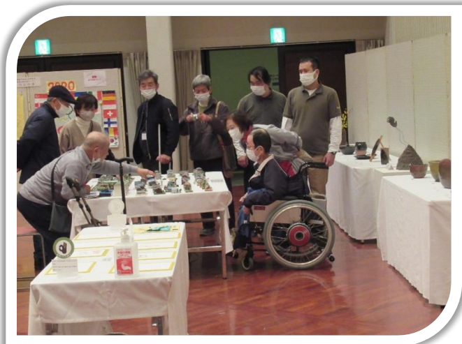
ジオラマ製作者の説明を多くの来場者が興味深く聞かれていました。