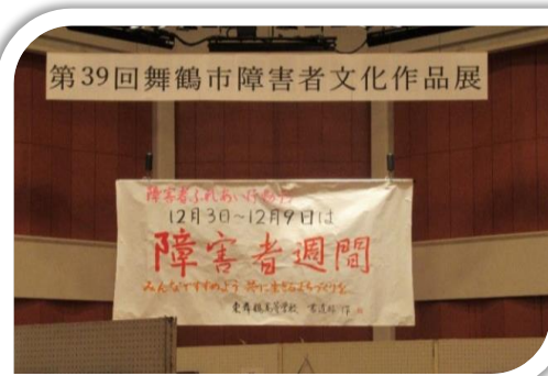
東舞鶴高校書道部に依頼し「障害者週間」の文字と活動テーマを書いていただきました。作品の一つとしてホールに展示し多くの方にご観覧いただきました。