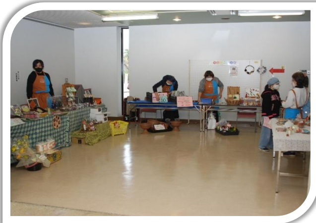
12月4日にはMAIスターに参加している就労支援事業所が自慢の自社製品を販売しました。