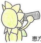
恵方巻き「ガブリッ」