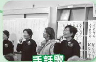
手話歌 すみれサークル