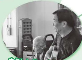
ウクレジャズがピコラー ブアマナ