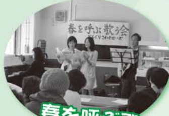
春を呼ぶ歌 どんぐりさわやかース