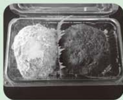
きなこ粒あんのおはぎ

身障センターでは毎週火・水・木曜日、きなこ粒あん2種類が入ったおはぎを販売しています。「はまってしまった!」と何度も購入される方が多いです。まだ召し上がってない方は、ぜひご賞味ください。