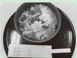
とてもおいしそうです。