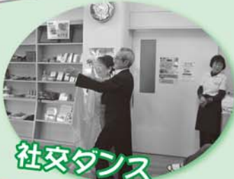
社交ダンス 木踊会