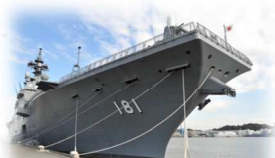
護衛艦「ひゅうが」

さて、何をさせていただこうかと思案した結果、普段なかなかできない、高いところのぼつての玄関の洗い流し清掃や、大きな公用車の洗車をしていただきました。水仕事で、ずぶ濡れになりながらも、熱心に作業をお世話になりました。お忙しい合間だったと思いますが、どうもありがとうございました。