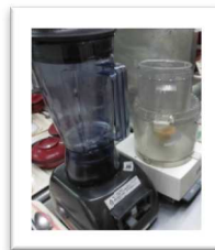
ミキサー食や刻み食、低カロリー食にも 対応しています。