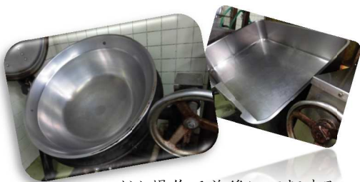
ハンドル操作で前後に回転する 大鍋&ティルティングパン

最近の自信作はカニちらし寿司♪ みなさんに大人気なのは、お好み焼・カレー・ピザですね。 メリハリのある献立、そして出来る限り手作りするをモットーに日々調理しています！