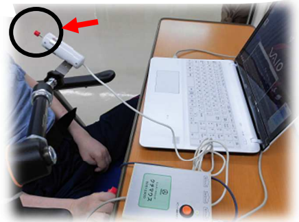
この赤い部分を口にくわえて舌で動かします