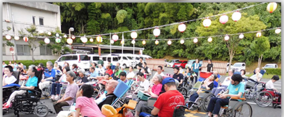
演奏に聴き入る利用者のみなさん