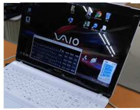
ポインターを画面上のキーボードに合わせて操作します