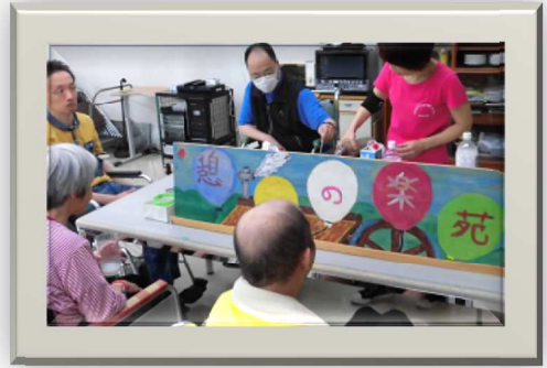
挽きたてコーヒーのいい香り♥

当施設では、毎週水・土曜日午前10時～喫茶店をオープンし、入所者のみなさんの憩いの場となっています。