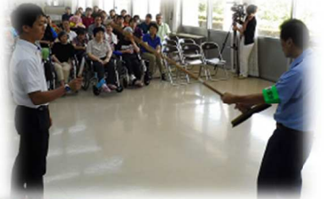
ぼうきなどを使って身を守る！

相模原市の障害者施設での殺傷事件を受け、当施設で8月10日(水)、舞鶴警察署協力のもと暴漢への対応訓練を実施しました。訓練では職員25人、施設利用者30人が参加。真剣な表情で、不審者への対応や防犯の心構えなどを聞きました。