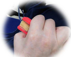
中央がスポンジになった 柔らかい装置でクリック可能