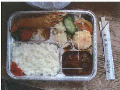
宮津といえば...S養軒様