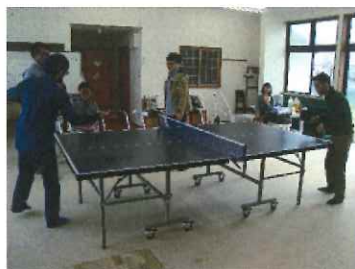
卓球大会もしましたよ