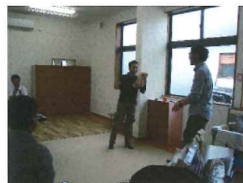
優勝は所長でした^_^